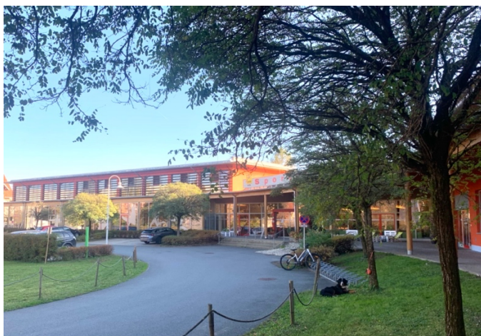
Wettkampfbereich: JUFA Hotel Leibnitz