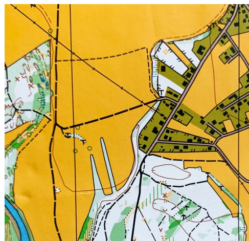
Kartenausschnitt ÖM Nacht