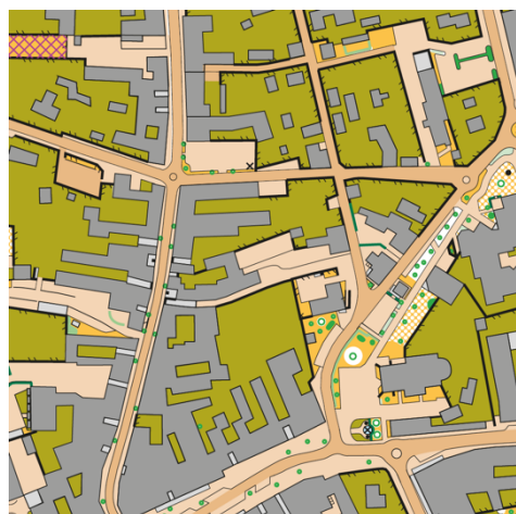
Kartenausschnitt 2. AC, Sprint